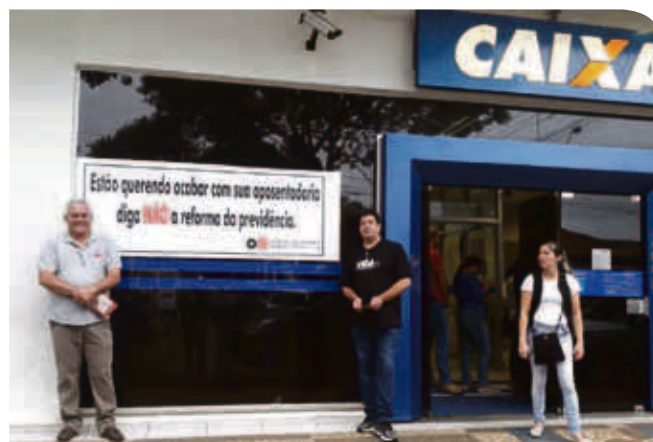
Atividade do Sindicato de Arapoti denuncia o ataque do governo Temer à aposentadoria dos trabalhadores