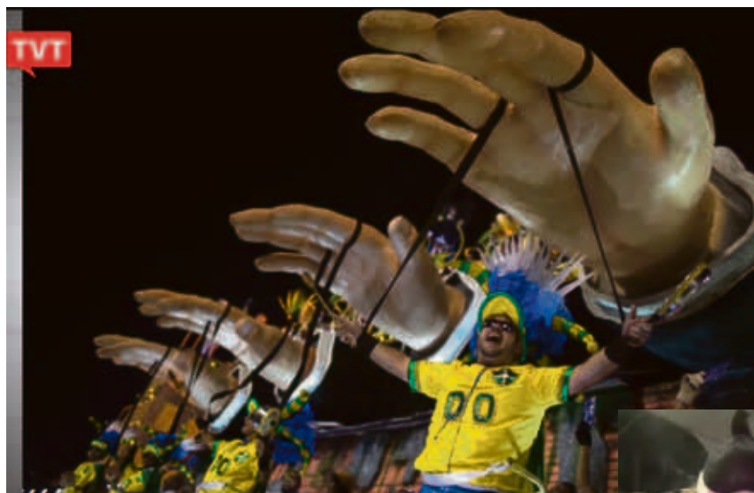
A Escola Paraíso do Tuiuti apontou a manipulação feita pela mídia para derrubar Dilma Rousseff

Os festejos do Carnaval de 2017 no Brasil tiveram como principal mote o combate à corrupção, a manipulação da mídia e os ataques que o governo Michel Temer (PMDB) tem feito contra a Classe Trabalhadora. De Norte a Sul, foliões, blocos e escolas de samba se inspiraram nos principais problemas enfrentados pela população brasileira nos tempos atuais para unir a festa com uma boa dose de críticas. Com o enredo "Monstro é aquele que não sabe amar – os filhos abandonados da pátria que os pariu", a Beija-flor foi a campeã do desfile das escolas de samba do Rio de Janeiro. Apesar de ter abordado a violência, a desigualdade social e a intolerância racial, de gênero e religiosa, não conseguiu ir à fundo no tema, repetindo o discurso que a classe média quer ouvir. Mas foi a Paraíso do Tuiuti, a segunda colocada na Marquês da Sapucaí, que levantou as arquibancadas com o enredo "Meu Deus, meu Deus, está extinta a escravidão?". Seus integrantes levavam carteiras de trabalho rasgadas, numa clara denúncia contra da reforma trabalhista