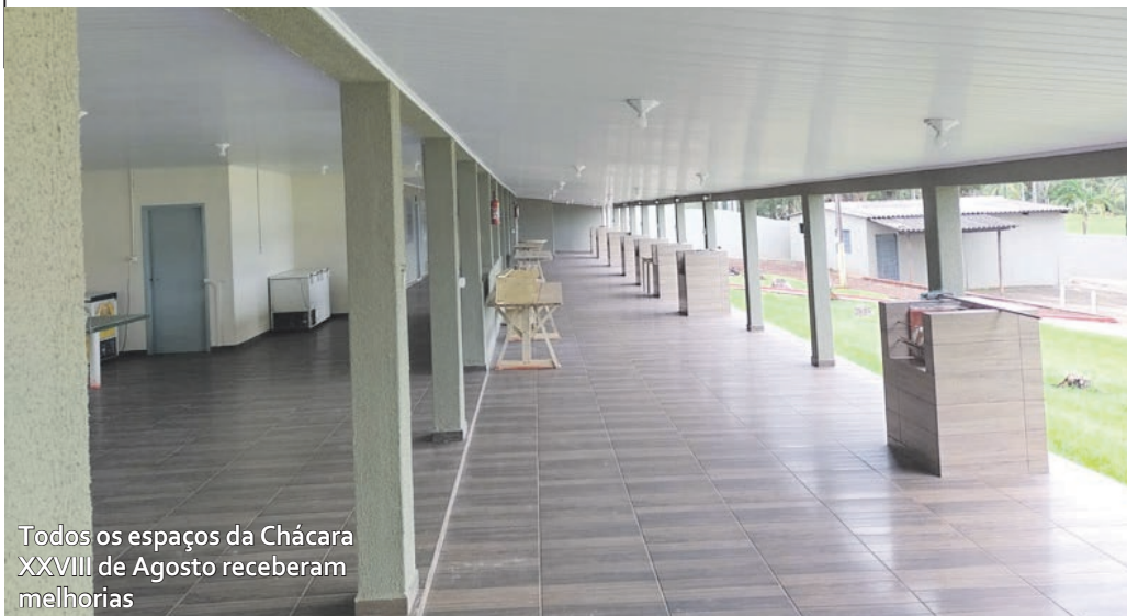
Todos os espaços da Chácara XXVIII de Agosto receberam melhorias